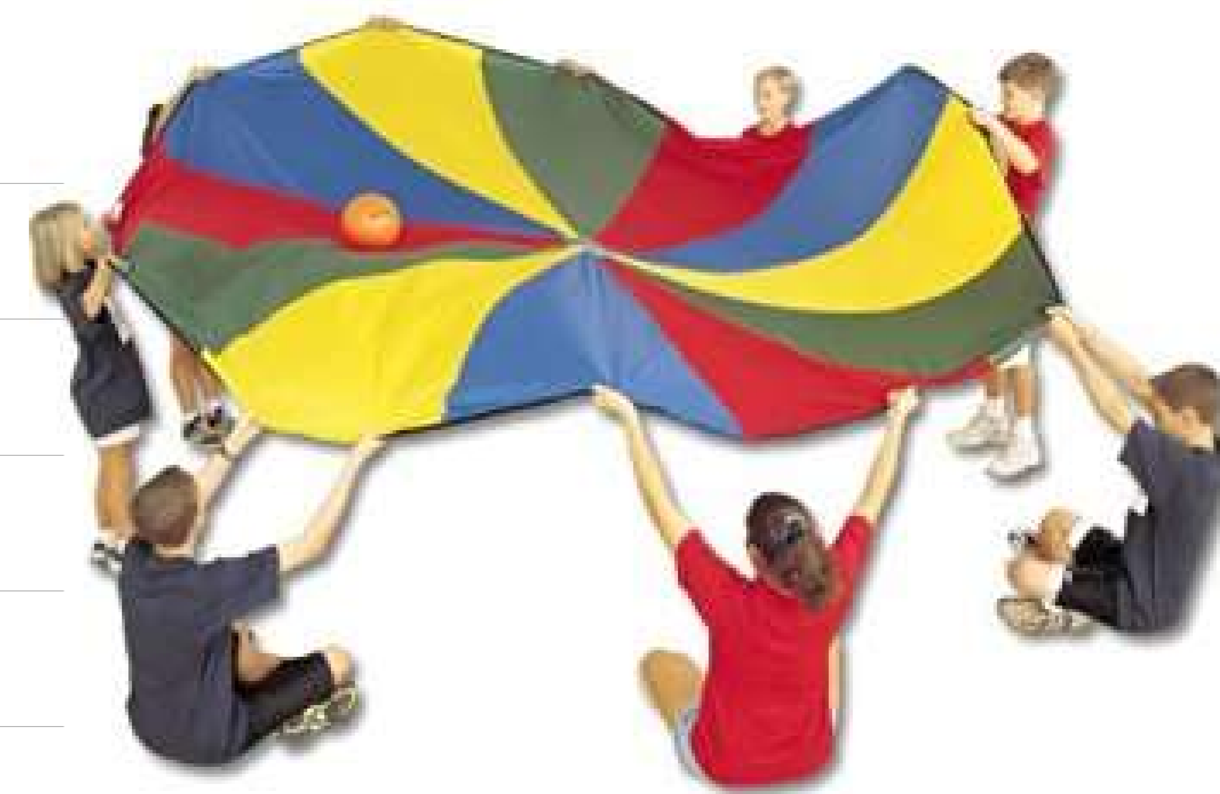
Figura 2 - Ludicidade como objeto de estudo nos anais do Fórum internacional de Ginástica Geral (2001-2014)